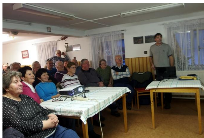
Beseda o obchůdcích

Na březem je připravena beseda na téma 15 let s Orlickými kilometry. Tentokrát v prostorách Domu hasičů. Je to příležitost zavzpomínat na léta, která Mladkov proslavila ve světě turistiky celého tehdejšího Československa.