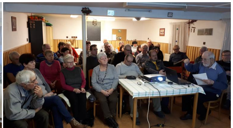
Beseda o starých mapách