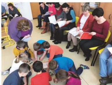
Ukázková hodina na téma Spolupráce učitele a asistenta pedagoga

Veškeré informace najdete na www.maporlicko.cz . Zde je k dispozici i KVARTETO ze školního prostředí, které jsme zpracovali a které si můžete zdarma stáhnout a zahrát.