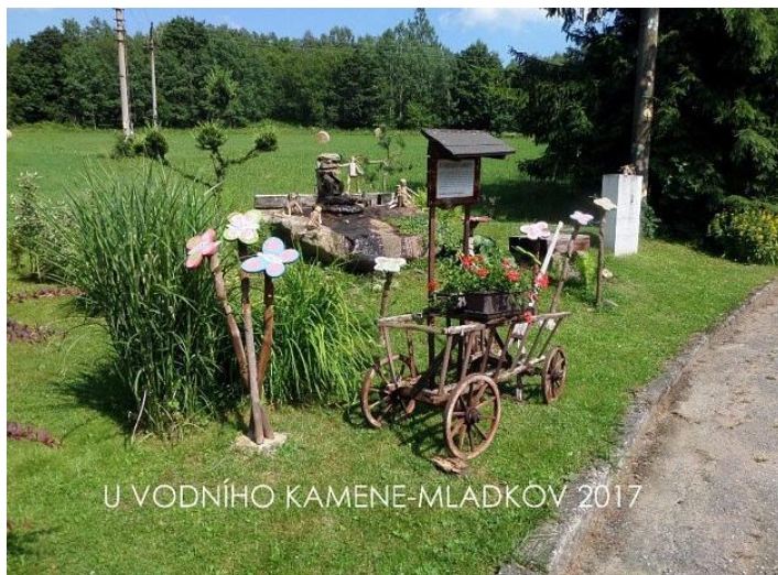
U VODNÍHO KAMENE-MLADKOV 2017

Hodně zklamaný jsem dojel do Mladkova, kde jsem si zlepšil náladu v kavárničce