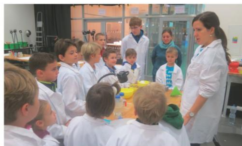
Pilotáž - Noc vědců v podání DDM Kamarád Česká Třebová

Na závěr bychom Vám rádi za celou místní akční skupinu popřáli krásné Vánoční svátky, rodinnou pohodu a mnoho úspěchů v roce 2018.