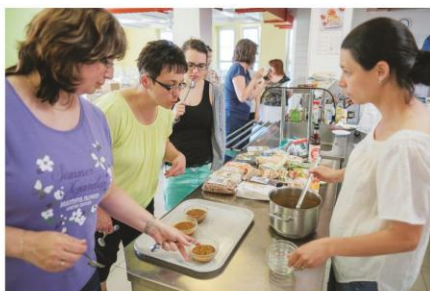
Praktický seminář na téma Luštěníiny