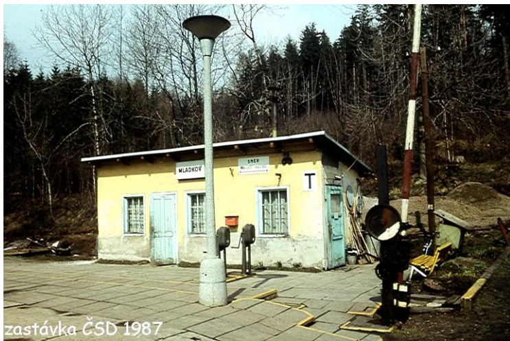
zastávka ČSD 1987