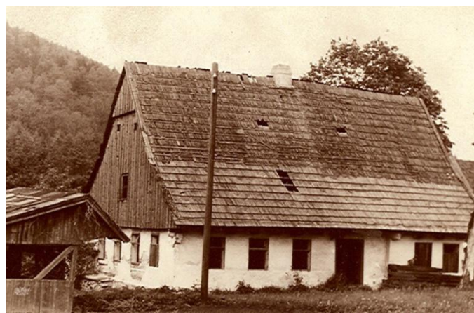
Grazschenka (archiv kroniky)