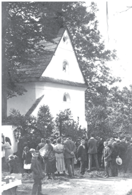
Pouť před kaplí 12. 9. 1928