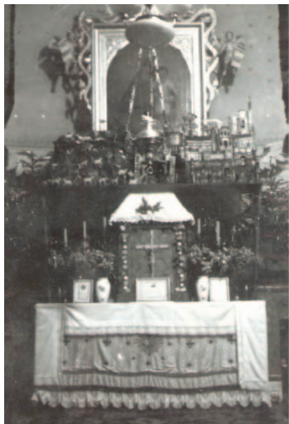
Oltář s vánočním betlémem (rok 1928)