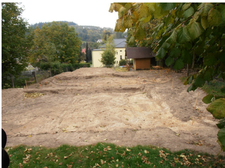
Úprava terénu před výstavbou