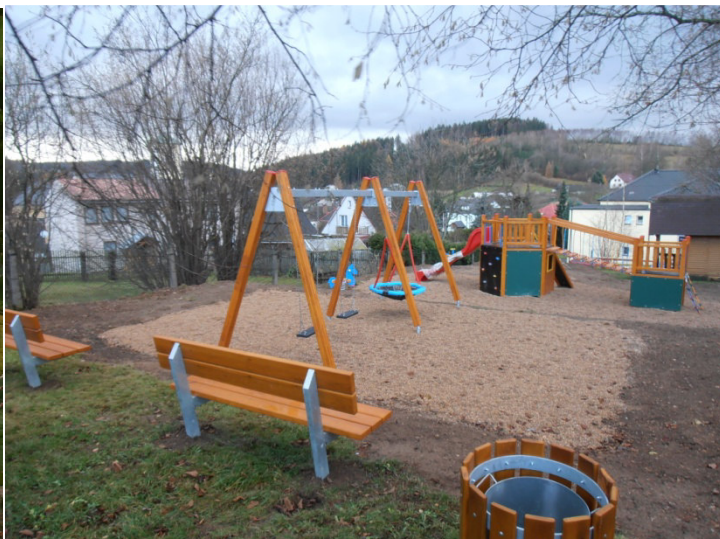
Dokončení dětského hřiště